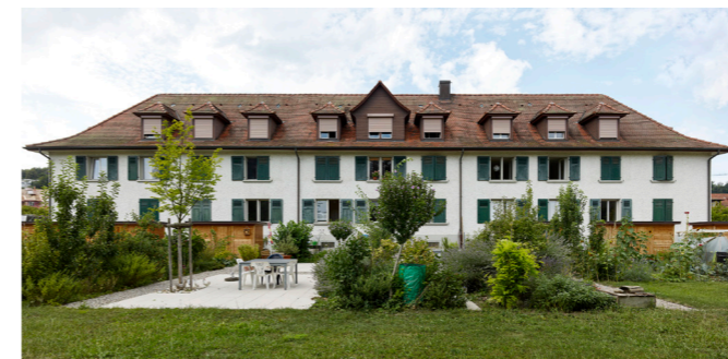
Früher Fotografie: Goran Potkonjak