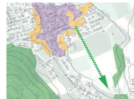
Blick in die Landschaft