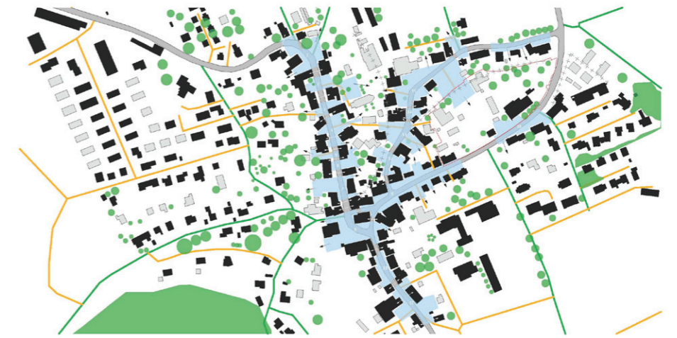
Analyse der Strassenräume