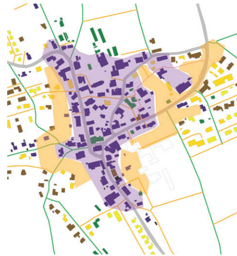
Analyse Gärten und Matten