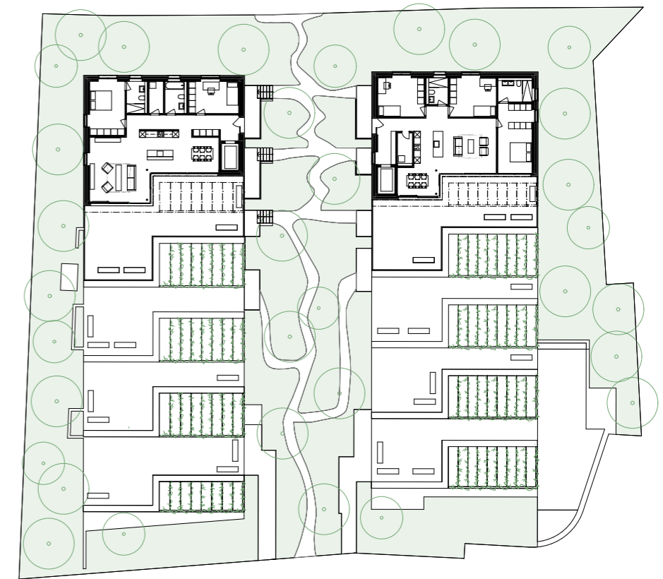
4. Obergeschoss 1:500