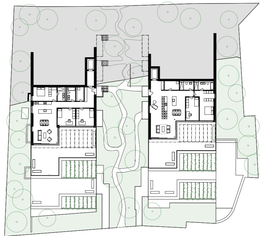
2. Obergeschoss 1:500