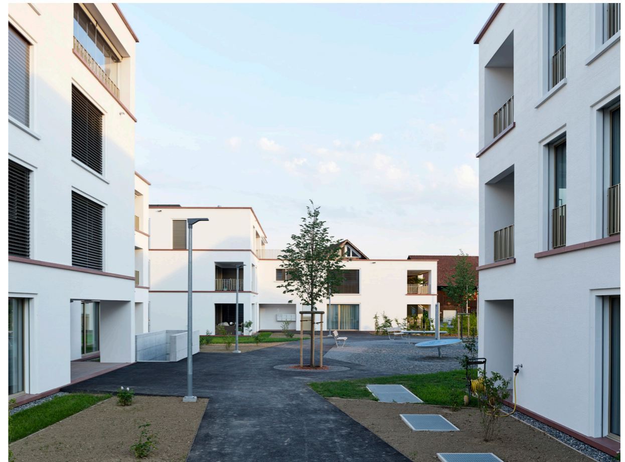
Fotografie Goran Potkonjak