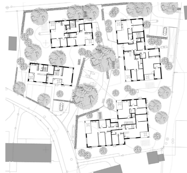
🕒 Umgebungsgestaltung 1:1000