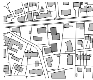
🕒 Situationsplan 1: 5000